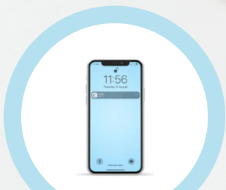
SMS, Whatsapp o App